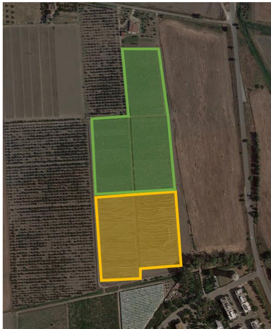
Figura 1 - Superficie coltivata a Uva Italia (verde) e nuovo impianto di uva apirene (giallo).

Tutta la produzione è stata sempre destinata al mercato italiano dell'ingrosso.