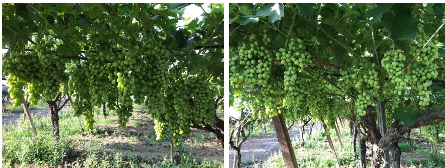
Figura 2 - Impianto di Uva Italia coltivata con Bio Aksxter® dell'azienda agricola Emanuele Fontana, giugno 2018

Ad aprile 2018, nell'ottica di migliorare gli standard produttivi e di farlo in maniera sostenibile, l'azienda agricola Emanuele Fontana ha deciso di impiegare Bio Aksxter® M31 linea viticoltura sull'impianto di 2,5 ettari di uva Italia di 18 anni (ca. 2.500 piante).