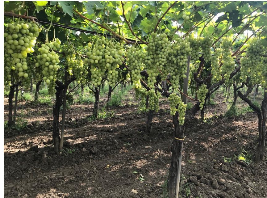
Figura 4 - Impianto di Uva Italia coltivata con Bio Aksxter®, luglio 2018